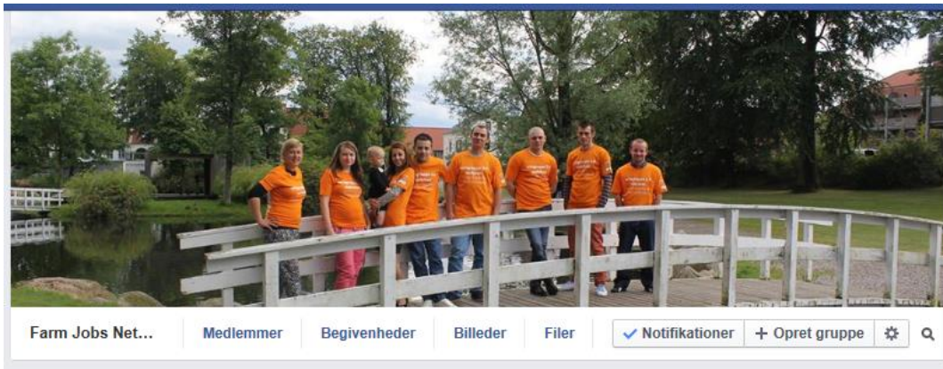
Billede 5 – Cover billedede fra vores egen ERFA gruppes FB side

Hvordan sikre vi engagement og udvikling i ERFA gruppen? Via løbende kommunikation og møder med personligt fremmøde, at vi laver løbende aftaler og holder dem, at vi er til at snakke med, at vi er åbne overfor nye ting og nye medier, medbestemmelse i planlægningen af arrangementer og indhold, at de vi snakker om er relevant og nogle gange det fagligt med inddragelse af relevante eksterne oplægsholdere eller virksomhedsbesøg.