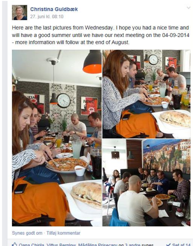
Billede 1 - Fra vores egen ERFA gruppes FB side