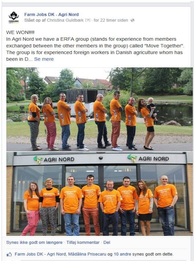
Billede 2

Siden sidste bedømmelsesrunde har vores gruppe været nævnt i flere medier, idet vi vandt sidste runde. Der har bl.a. været en artikel i Landbrugs Avisen, Aars Avis og en notits på Agri Nords egen hjemmeside og den interne Facebook side samt Farm Jobs DK (se vedhæftede filer, er vedlagt til bedømmelsen). Herunder har jeg indsat nogle af de billeder, som vi har taget og posted i forbindelse med fejringen af, at vi vandt.