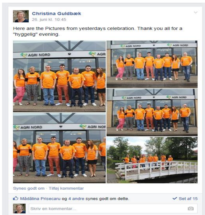
Billede 3